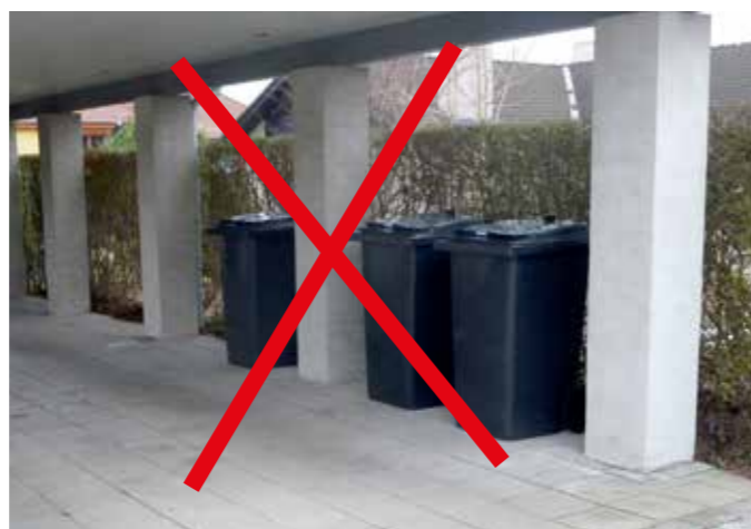
Belægningen er fin, men håndtag og hjul på alle tre beholdere vender den forkerte vej (væk fra skralde- manden)

Hvis du har nogle spørgsmål, så er du velkommen til at kontakte affaldsteamet i Brøndby Kommunes Miljøafdeling på tlf. 4328 2828 eller via E-mail på affald@brondby.dk