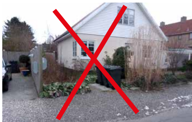
Selve standpladsen er fin med nylagte fliser, men der må ikke ligge perlegrus på adgangsvejen