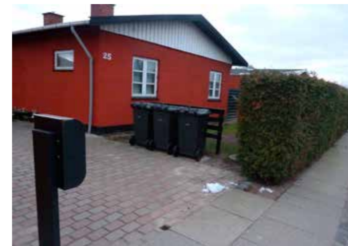
Her har borgeren valgt at sætte beholderne op ad et hegn