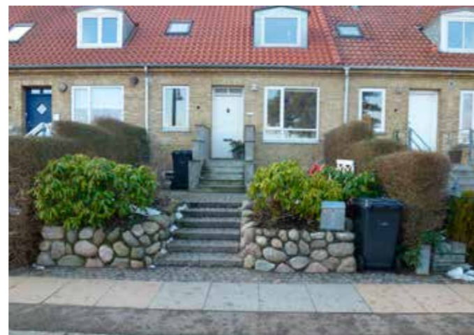
Her er der problemer pga. af trappen. Beboerne har valgt en enkelt standplads ved fortovet, hvor de stiller beholderen ned, når den skal tømmes