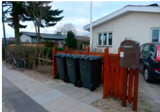
Borgeren har lavet en lille plads med hegn omkring