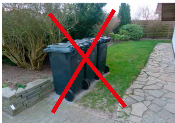
Her er det næsten i orden, men der skal lægges en stribe fliser mere, så skraldemanden ikke skal trække beholderen over græsset