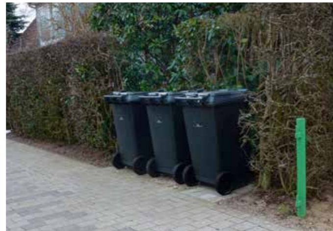
Her er beholderne nærmest "bygget ind" i hækken