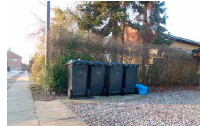
Her er der lavet en plads med fliser i perlegruset