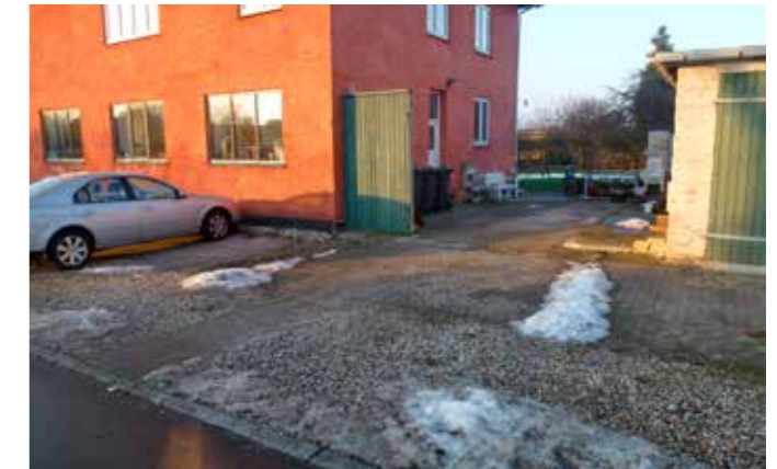
Her har borgeren lagt fliser igennem de løse sten for at lave en god adgangsvej for skraldemanden