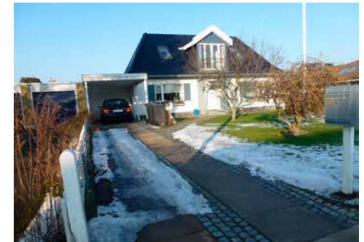
Praktisk placering på borgers vej til bilen