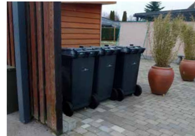
Også her har borgeren anlagt en standplads og kørevej med fast underlag