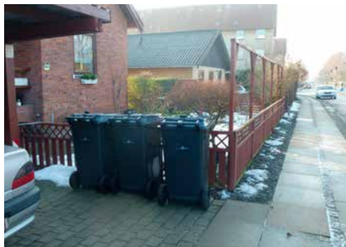
Borgeren har valgt at sætte beholderne ved fortovet