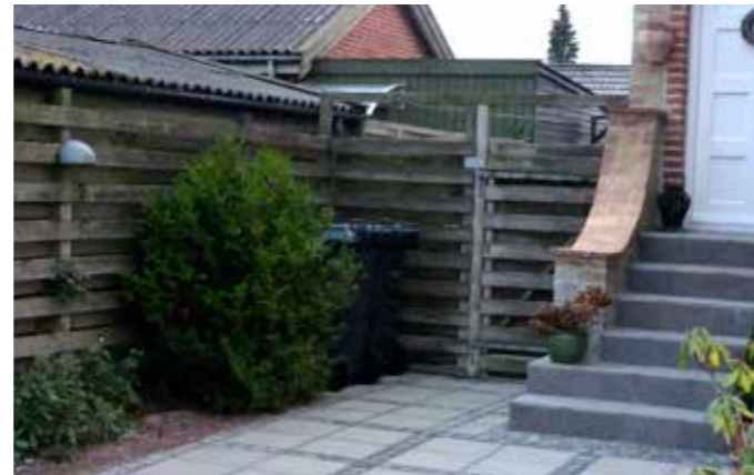
Beholderne kan placeres diskret i et hjørne, hvor de skærmes af en busk