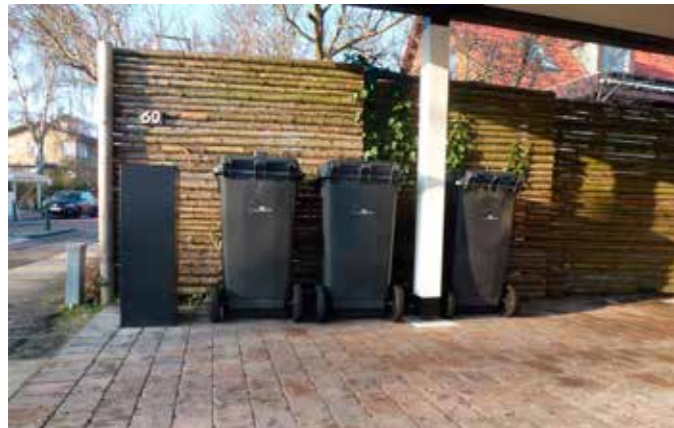
Beholderne kan placeres i carporten – her er de sat bag postkassen