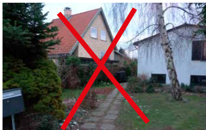
Disse fliser er ikke et jævnt underlag