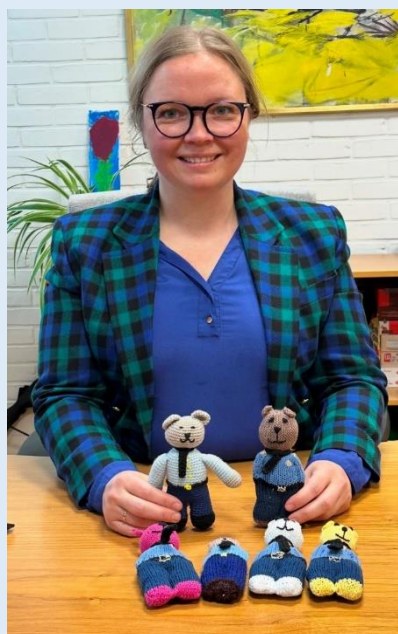
Borgmesterkontoret, Park Allé 160, 2605 Brøndby.

For at få endnu flere politibamser ud til børnene, har borgmesteren sendt strikkeopskrifter ud til strikke- og nørkleklubber i Brøndby. Alle, der har lyst, kan være med til at strikke eller hækle bamser. Når bamserne er færdige, kan de afleveres i Borgerservice på Brøndby Rådhus eller sendes til