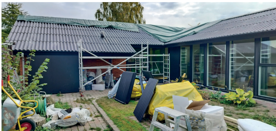
De nye regler om asbest har givet udfordringer i forhold til f.eks. nedtagning af asbesttage.

Størstedelen af asbestarbejde skal udføres af autoriseret arbejdskraft. Private må i visse