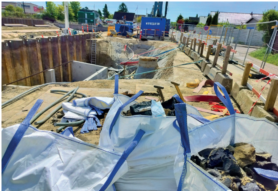
Brøndby Kommune udførte 50 styrkede affaldstilsyn i 2025, herunder 13 på byggepladser.

De styrkede affaldstilsyn er 100% gebyrfinansierede af de enkelte virksomheder, og foruden selve tilsynet må kommunen fakturere den tid, der bliver brugt på forberedelse, transport og opfølgende rapportskrivning m.m.