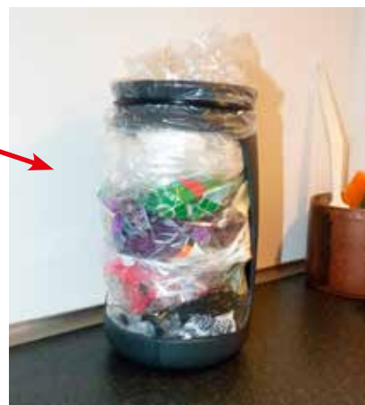
Borddispenser til blød plast