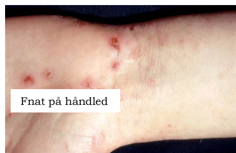
Fnat på håndled