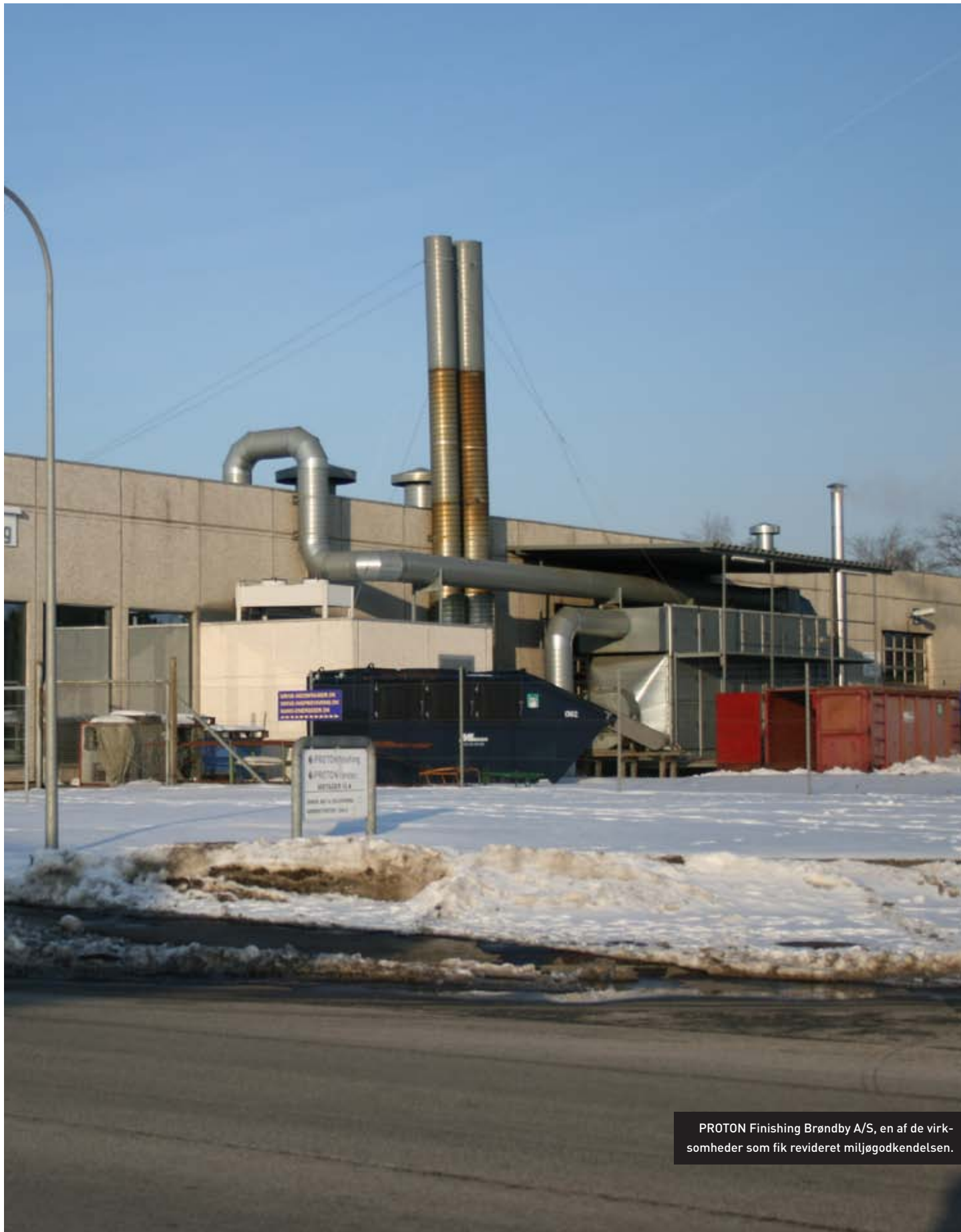
PROTON Finishing Brøndby A/S, en af de virksomheder som fik revideret miljøgodkendelsen.